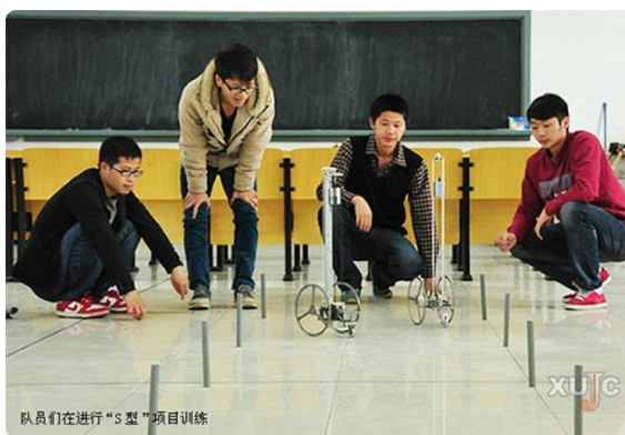
工程训练综合能力竞赛