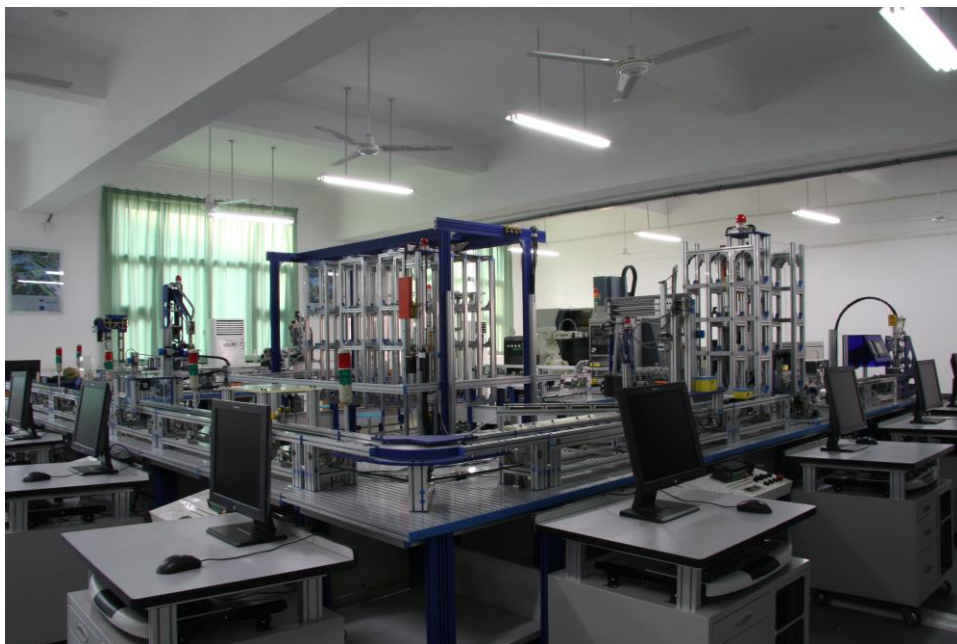
机电柔性制造系统（FMS）实训室