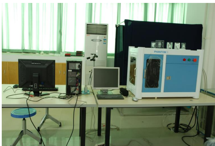
激光加工与快速成型室