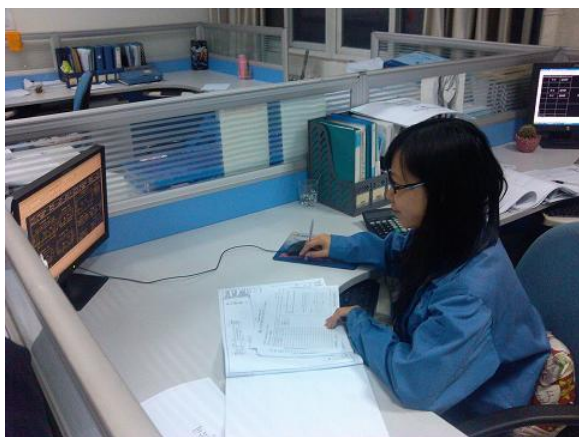
学生在金龙旅行车有限公司顶岗实习

机自专业目前与厦门金龙旅行车有限公司、厦门立林科技有限公司、厦门创信亿达精密科技有限公司、福建省海山重工制造有限公司、厦门凯思达电子有限公司等几十家单位共建实习基地，为学生提供理论联系实际的平台。