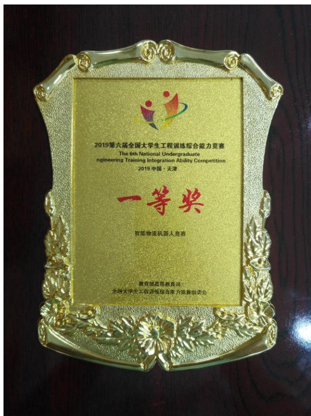
参加全国大学生工程综合能力竞赛获奖