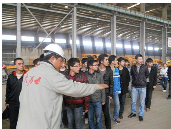
学生到泰华公司参观实习现场生产过程