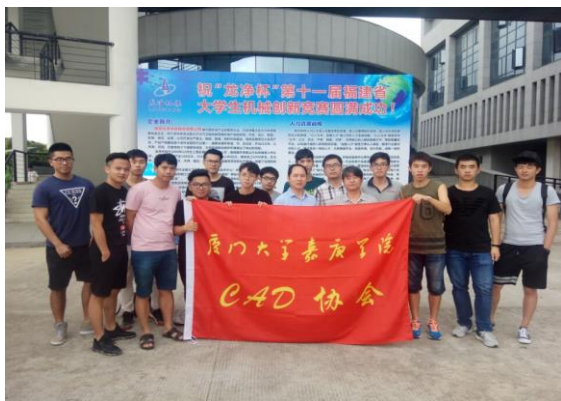
省机械创新设计竞赛

鼓励学生参加各种特色课外科技活动，培养学生参加实践和创新的能力，包括全国大学生机械创新设计竞赛、全国大学生智能汽车竞赛、全国大学生工程训练综合能力竞赛、“互联网+”大学生创新创业大赛等，以及校内和各种竞赛，并在各项赛事中取的好成绩。