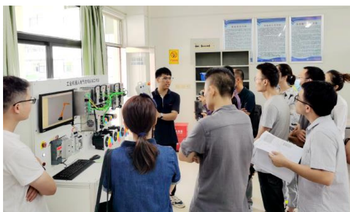
工业机器人实训设备