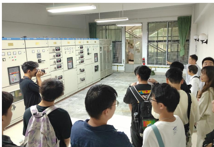
供配电系统参观实习

积极探索校企共育高素质人才的培养模式，与众多企业共建产学研一体的实践基地，为学生们创造专业对口和创新实践的优质平台，也为企业考察优秀人才提供了有利契机。大力倡导学生的创新创业竞赛活动，在“互联网+”、挑战杯、大学生工程训练综合能力竞赛、节能减排竞赛、大学生创新创业训练计划项目等学科竞赛中都活跃着电气学子的身影。