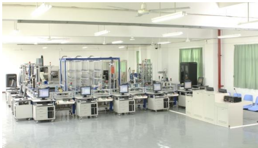
机电柔性制造系统（FMS）实训室