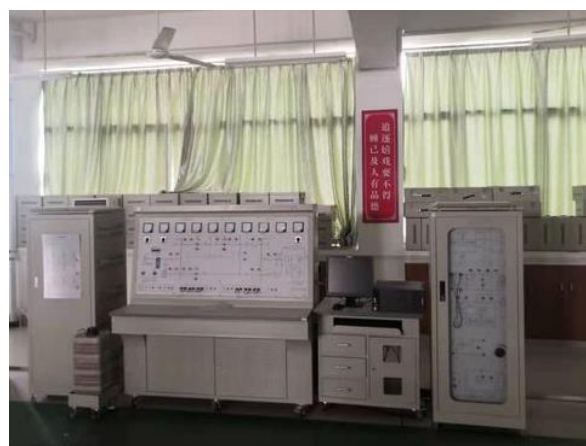
现代电力系统实训室