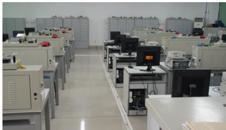
传感器技术实验室