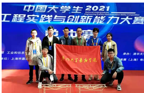
工程实践与创新能力竞赛