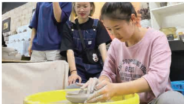
一年级，培田古村-版画写生创作，漳浦陶瓷造型创作