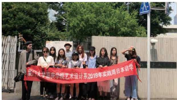
二年级，日本交流学习。武藏野大学交流学习