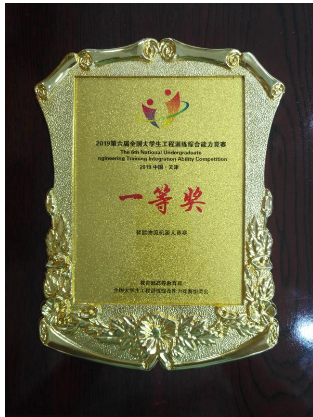
参加全国大学生工程综合能力竞赛获奖