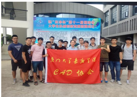
省机械创新设计竞赛

鼓励学生参加各种特色课外科技活动，培养学生参加实践和创新的能力，包括全国大学生机械创新设计竞赛、全国大学生智能汽车竞赛、全国大学生工程训练综合能力竞赛、“互联网+”大学生创新创业大赛等，以及校内和各种竞赛，并在各项赛事中取得的好成绩。